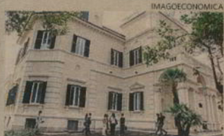
Luiss. Il palazzo acquistato dal gruppo Toti per 117 milioni